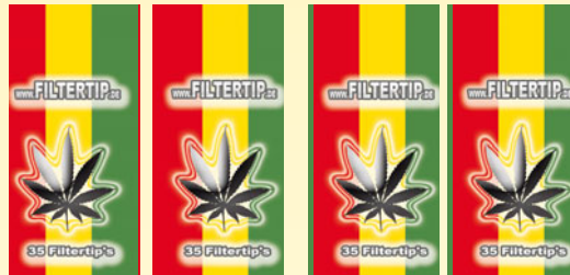
Bei solchen Hintergründen kann es beim Schneiden passieren, dass 1-2mm breite Farbstreifen des benachbarten Druckes stehen bleiben.

Der Hintergrund des Deckels muss einfarbig angelegt werden oder es wird ein durchgängiges einheitliches Muster hinterlegt da es produktionsbedingt zu Schneid-schwankungen von 1-2 mm kommen kann. Am Beispiel sieht Ihr was passiert wenn dies nicht beachtet wird.