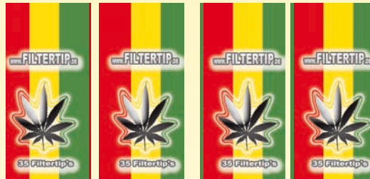
Bei solchen Hintergründen kann es beim Schneiden passieren, dass 1-2mm breite Farbstreifen des benachbarten Druckes stehen bleiben.

Der Hintergrund muss einfarbig angelegt werden oder es wird ein durchgängiges einheitliches Muster hinterlegt da es produktionsbedingt zu Schneid-schwankungen von 1-2 mm kommen kann. Am Beispiel sieht Ihr was passiert wenn dies nicht beachtet wird.